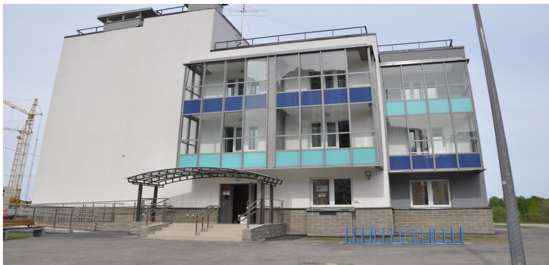
Рисунок 2 –дом сопровождаемого проживания ГАООРДИ

Проект реализуется с 2015 г. в рамках общественно-частного партнерства: ПАО «Группа ЛСР» совместно с Санкт-Петербургской ассоциацией общественных объединений родителей детей-инвалидов «ГАООРДИ» при поддержке Комитета по социальной политике Санкт-Петербурга, Комитета по труду и занятости населения Санкт-Петербурга и администрации Красногвардейского района Санкт-Петербурга. По состоянию на 01.01.2023 г. функционирует 2 отдельно стоящих трехэтажных жилых дома сопровождаемого проживания (рис.2).