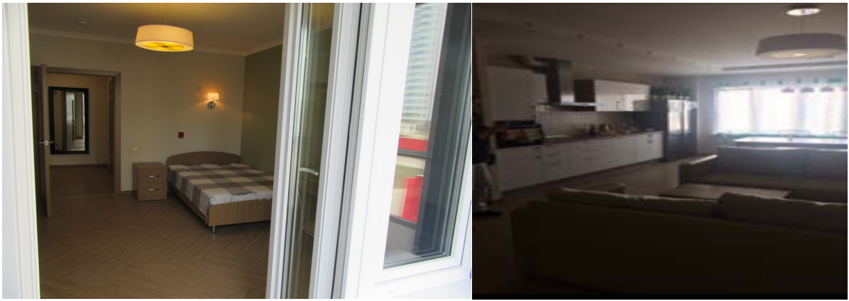
Рисунок 3, 4 - Гостиная и жилая комната в доме ГАООРДИ

Оснащение квартиры произведено за счет внебюджетных источников (средств инвесторов). В процессе проживания инвалидам оказываются услуги и мероприятия по сопровождению. Предоставление услуг осуществляется «Службой сопровождаемого проживания» 24 ч. в сутки. На одну квартиру рассчитано четыре социальных работника (на один дом 12 ставок), которые работают посменно. Помощь оказывается в уходе, личной гигиене, покупке продуктов питания, одежды и обуви, приготовлении и приеме пищи, стирке, уборке, в уходе за одеждой и мебелью и т.д. Имеется также психолог и социальный педагог.