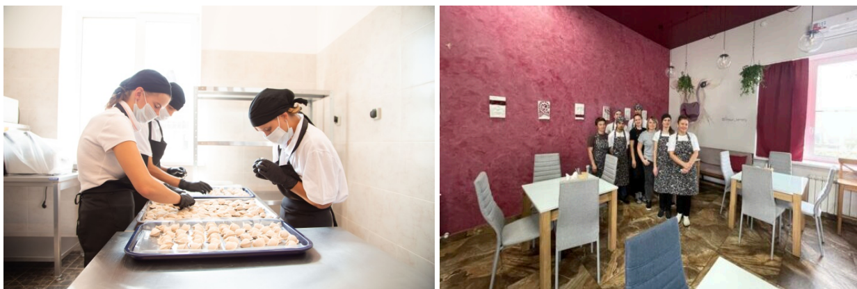
Рисунок 11, 12 – Кафе и цех по производству полуфабрикатов

На рисунках 11, 12 представлены цех по производству полуфабрикатов и кафе, в котором работают ребята.