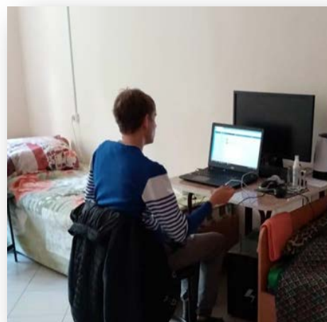
Рисунок 8, 9 – Стажировка в условиях тренировочного общежития

Сопровождение самостоятельного проживания в арендованной квартире включает взаимодействие специалистов и обучающихся 2-3 раза в месяц в период адаптации на производстве, в условиях самостоятельного проживания; оказание консультативной юридической, финансовой, психологической поддержки.