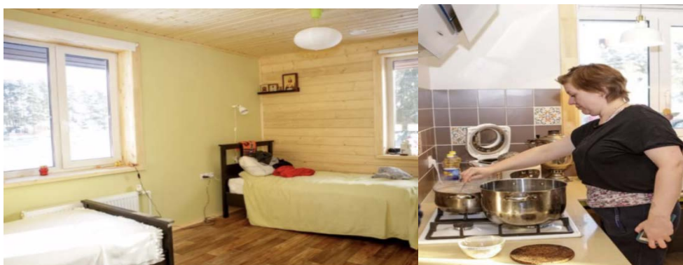
Рисунок 5 – Квартира в доме в селе Раздолье

Материально-техническое оснащение квартиры выполнено за счет средств инвесторов (рис. 5).