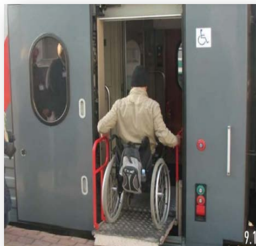
Рисунок 6, 7 – Изучение основ формирования жизненно необходимых знаний и навыков на практике

Процесс трудоустройства и последующего сопровождения включает три этапа: