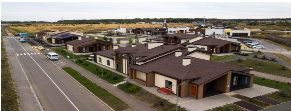
Рисунок 10 – арт-поместье «Новые Берега»

Современной резиденцией для молодых людей с инвалидностью стало открытое в 2020 г. арт-поместье «Новые Берега» (рис.10). На площади 7600 кв.м. построен коттеджный поселок с развитой инфраструктурой для людей с нарушением слуха, зрения, опорно-двигательного аппарата и ментальными отклонениями.