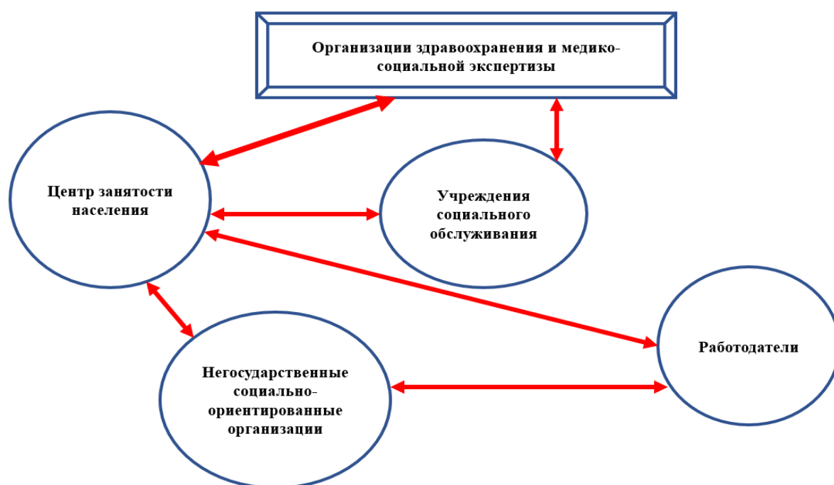
Рисунок 1 – Модель межведомственного взаимодействия в процессе сопровождаемой трудовой деятельности

Модель межведомственного взаимодействия в процессе сопровождаемой трудовой деятельности представлен на рисунке 1.