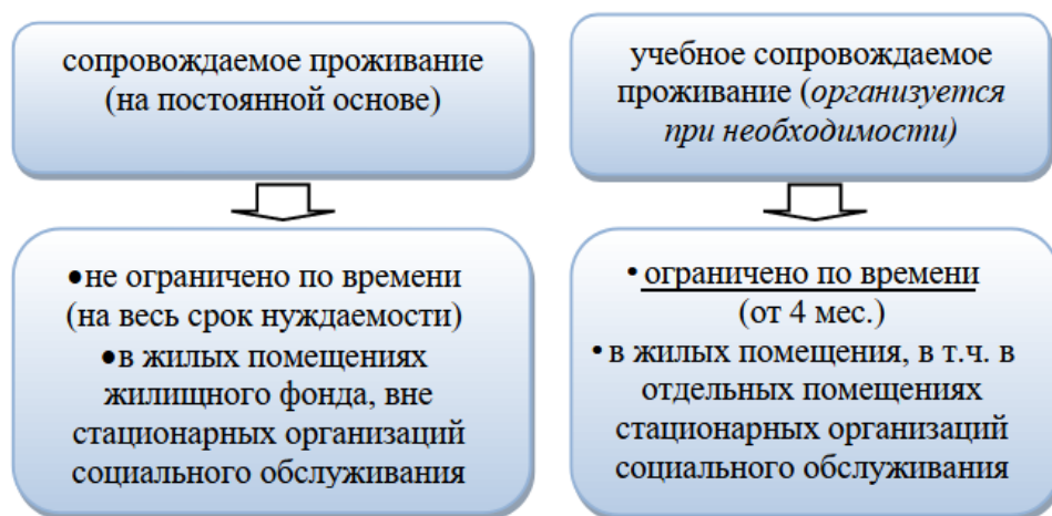
Рисунок 2 – Основные различия сопровождаемого проживания и учебного сопровождаемого проживания инвалидов

Для целей сопровождаемого проживания рекомендуется использовать жилое помещение, находящееся в собственности инвалида, предоставленное ему на условиях социального найма, находящееся в собственности негосударственных организаций социального обслуживания, в помещениях, арендуемых поставщиками социальных услуг, или на условиях возмездного или безвозмездного пользования помещениями, находящимися в специализированном жилищном фонде системы социального обслуживания, а также в специализированных помещениях государственного и муниципального жилищных фондов, в том числе на условиях коммерческого найма. (рис. 2).