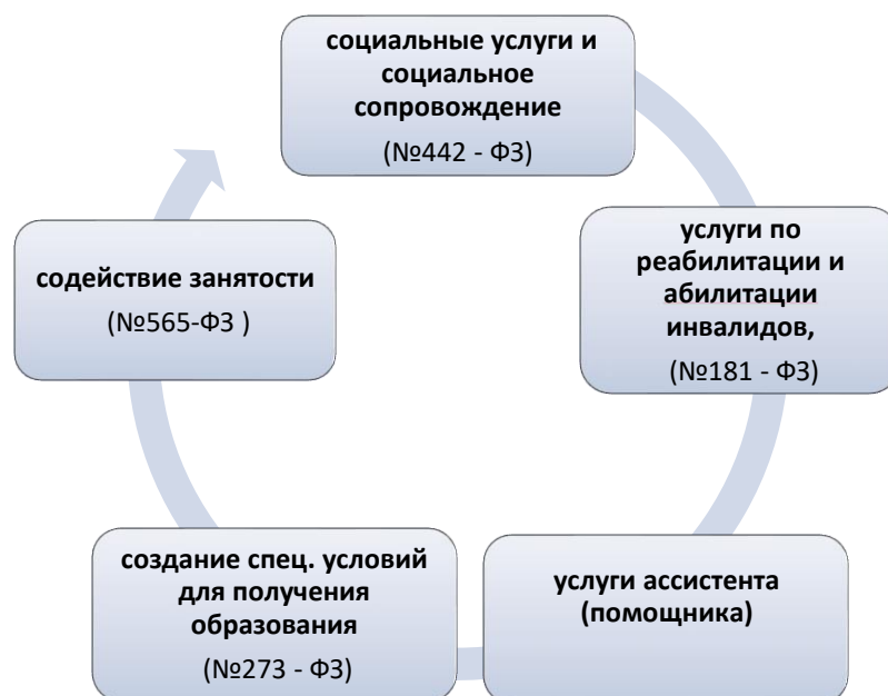
Рисунок 4 – Комплекс услуг и мероприятий, предоставляемых инвалиду на сопровождаемом проживании

Услуги и/или мероприятия в рамках сопровождаемого проживания предоставляются на весь срок нуждаемости инвалида в сопровождаемом проживании.