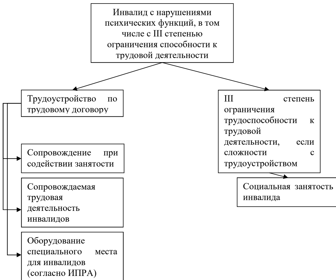
Рисунок 3 - Варианты занятости инвалидов с нарушениями психических функций

Варианты занятости инвалидов с нарушениями психических функций представлены на рисунке 3.